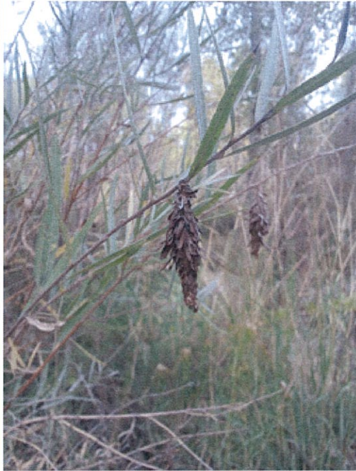
2014 Unidentified School